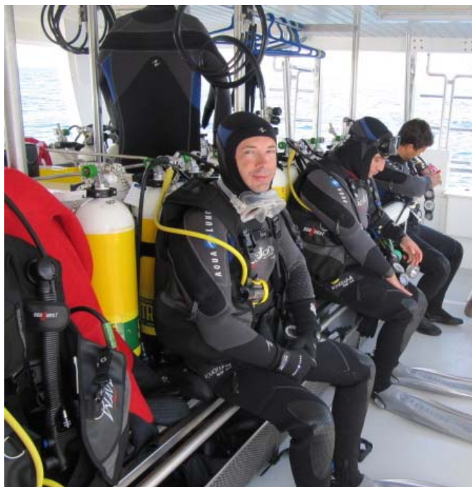
Momentos antes do mergulho

O primeiro mergulho foi no Wilhelm Krag, cargueiro norueguês atingido pelo submarino alemão U35 durante a 1ª Guerra Mundial (a 24 de Abril de 1917), depois de um reforço do pequeno almoço, o grupo efectuou o 2º mergulho no Océan, navio almirante de 80 canhões de uma frota Francesa de 14 navios que em plena Guerra dos Sete Anos se envolveu num confronto com a poderosa armada Inglesa, a 18 de Agosto de 1759 na Batalha de Lagos teve o seu capítulo final.