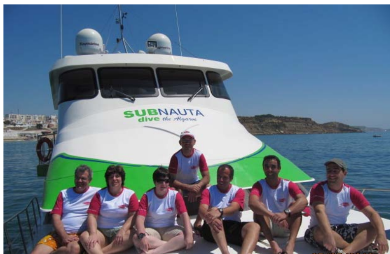
Grupo de participantes

No passado fim-de-semana de 23 a 25 de Julho, realizou-se o 1º Mini-Liveaboard (Rota dos Naufrágios) promovido pela Secção de Mergulho do Sul em parceria com Subnauta, onde participaram 7 mergulhadores.