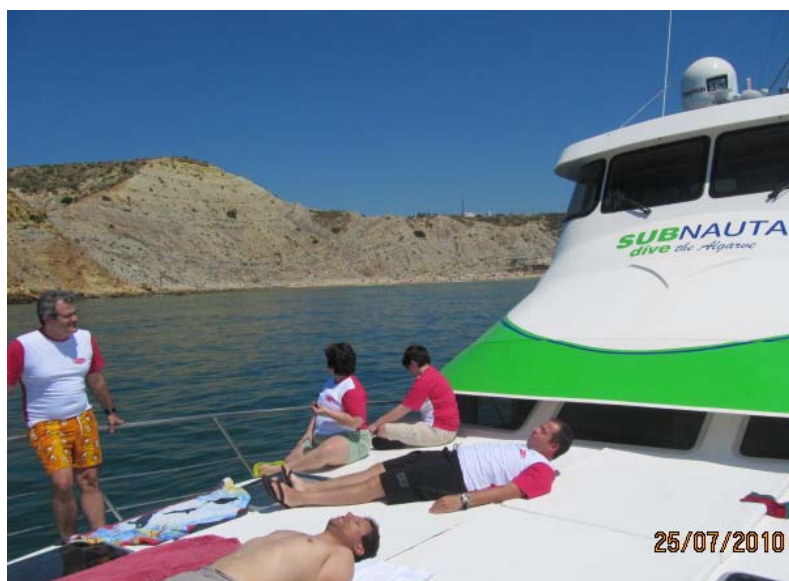
Descanso entre mergulhos

O dia terminou com um jantar num restaurante local em Sagres.