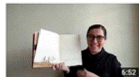
Uma história por dia, não sabe o bem que lhe fazia S1 E11 6:52