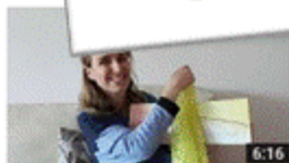
Uma história por dia, não sabe o bem que lhe fazia S1 E14 6:16