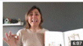
Uma história por dia, não sabe o bem que lhe fazia S1 E12 6:07