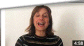
Uma história por dia, não sabe o bem que lhe fazia S1 E13 4:58