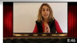
Comemorações do Dia Internacional do Livro Infantil, 2 ... 8:46