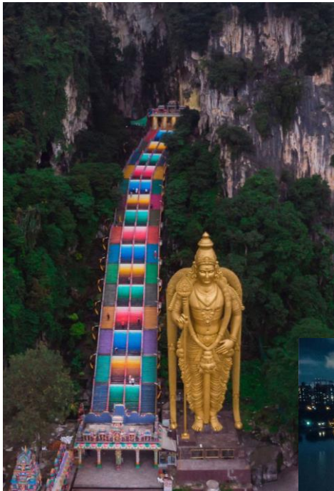
Kuala Lumpur, Malásia

https://viagens.sapo.pt/viajar/viajar-mundo/artigos/os-sitios-mais-maravilhosos-do-planeta-vistos-desde-cima-e-portugal-faz-parte-da-galeria#&gid=1&pid=1