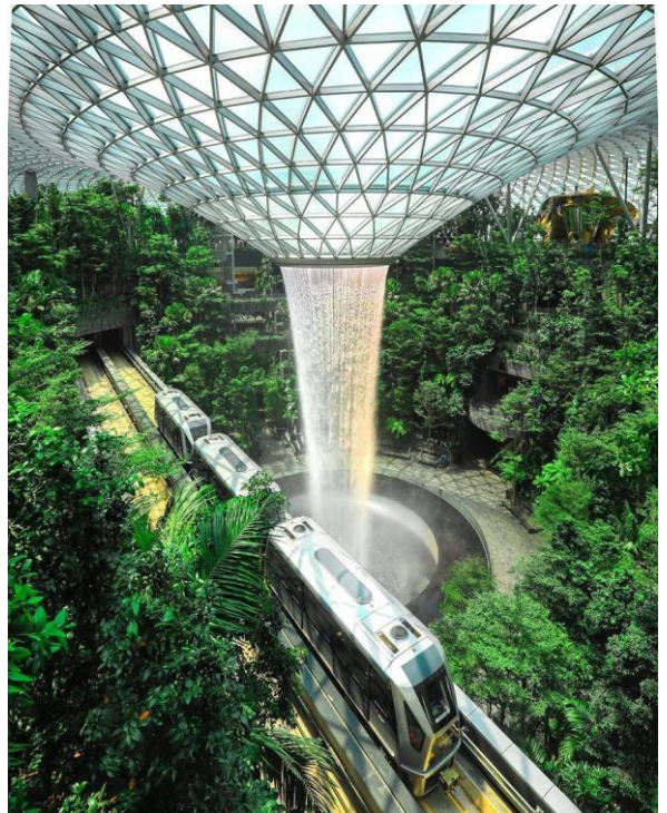
Aeroporto Jewel Changi, Singapura