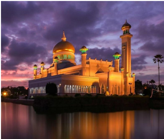
Bandar Seri Begawan, Brunei