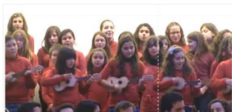
"Cantar das Janeiras"

Cerca de sessenta alunos da CSI Diogo Bernardes responderam ao convite feito pela Câmara Municipal de Ponte da Barca e deram as boas vindas ao novo ano acompanhados ao som dos cavaquinhos.