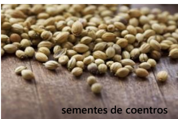
sementes de coentros