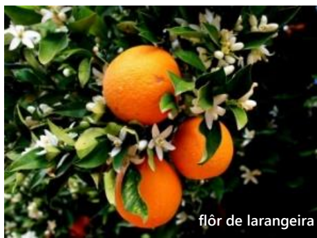
flôr de laranjeira