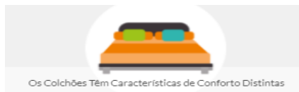
Os Colchões Têm Características de Conforto Distintas