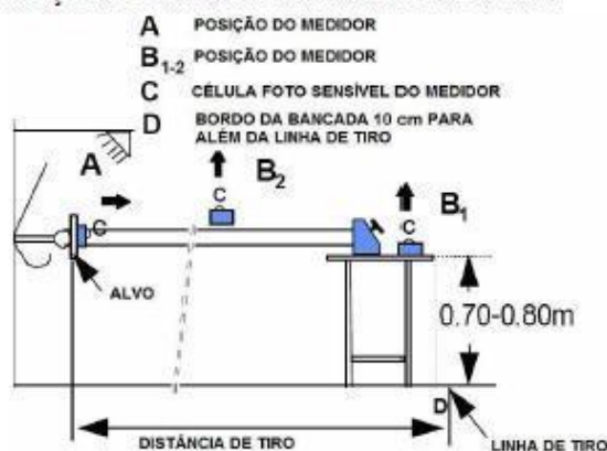
6.3.17.4 Medição de Luminosidade na Carreira de Tiro interior.